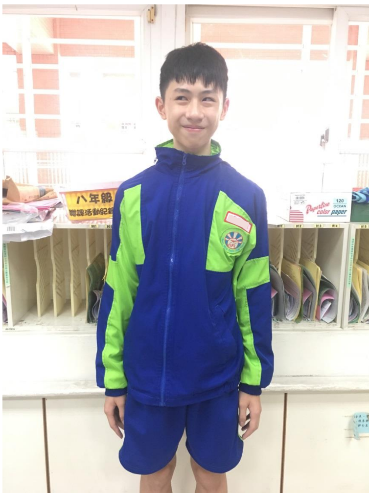
外套-縫於左邊校徽上方，勿遮住校徽，男女亦同。