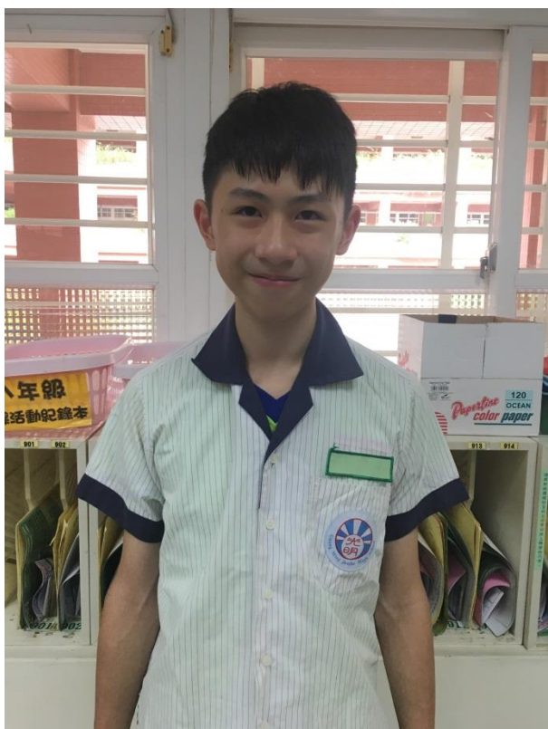
制服-縫於口袋上方，男女亦同。